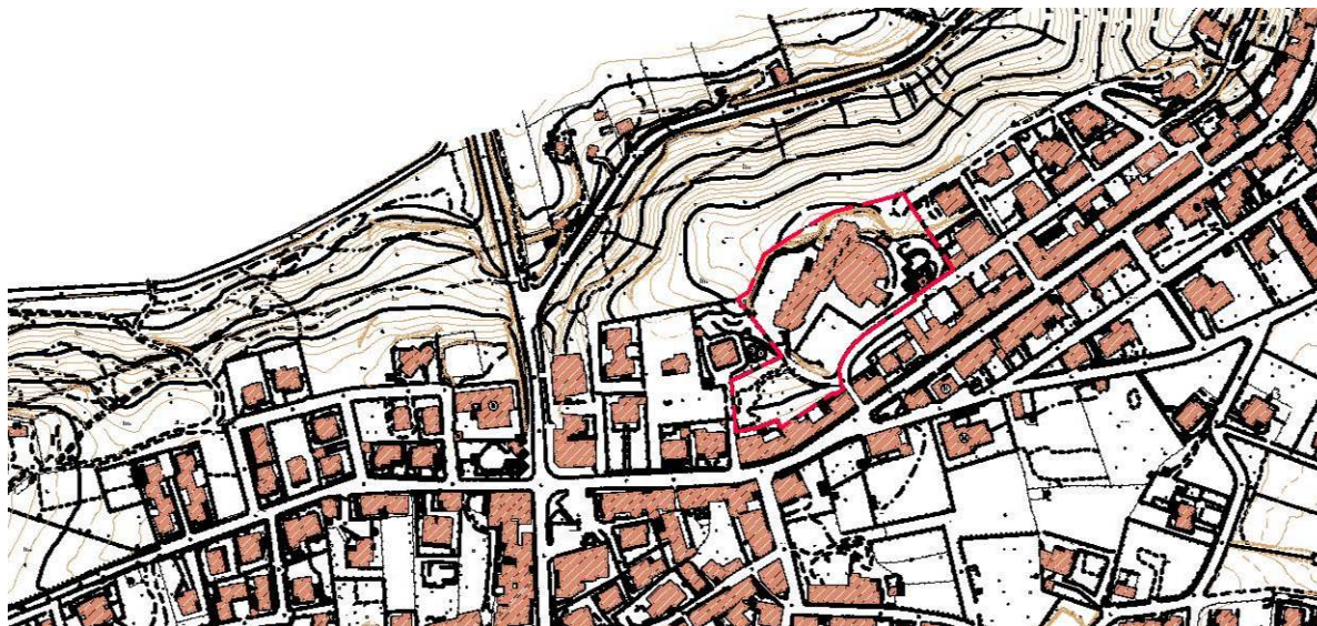
Inquadramento in scala 1:5000